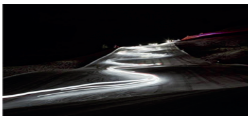
Ore 21,30 tradizionale Fiaccolata notturna in Selva Val Gardena, loc. Freina.