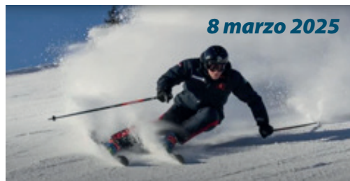
Ore 09.30-14.00 gara di sci nelle discipline di Slalom Gigante (1 manche sulla pista Val) e di Fondo (5 km sulla pista Vallunga)..