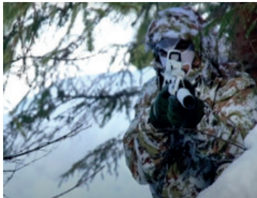
Ore 16.30-18.30 Stage per tiratori scelti con infiltrazione da Plan de Gralba, movimento in ambiente innevato e tiri con abbattimento di soggetti ostili presso la Cava di Pra Nives.