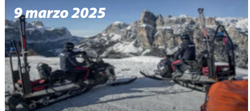
Ore 09.00-14.00 mostra statica di mezzi dell'Arma dei Carabinieri con dimostrazione tattica di primo intervento Antiterrorismo e mostra espositiva dei Carabinieri Forestali (CUFA) in Piazza Nives di Selva Val Gardena.