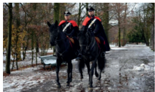
Ore 09.00-14.00 pattuglia dei Carabinieri a Cavallo in Piazza Nives di Selva Val Gardena.