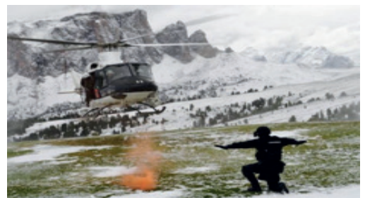
Ore 12.00 aviolancio del Centro Sportivo Carabinieri Paracadutisti con tecnica a caduta libera e atterraggio di precisione su neve, da un elicottero Arma AB412 e il dispiegamento del Tricolore Italiano in Selva di Val Gardena, loc. Piz Sella.

All'evento parteciperanno delegazioni internazionali di F.P. che collaborano con l'Arma in ambito UE e NATO.