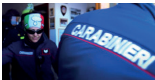
Ore 16.30 cerimonia di premiazione delle gare Ore 17.00-19.00 dj set e bevande calde