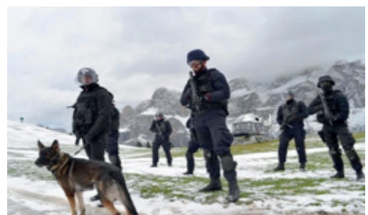
Ore 11.00 scenario di soccorso in montagna con unità cinofila e mostra sull'equipaggiamento di sci/alpinismo. presso l'Area dell'Alpe di Siusi (rifugio Compac).